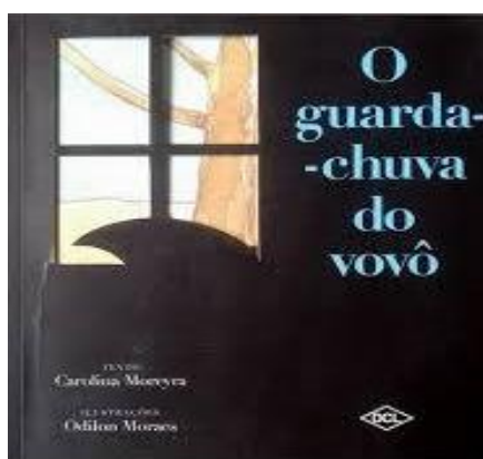
Figura 4: O guarda-chuva como vestígio, em O Guarda-Chuva do Vovô