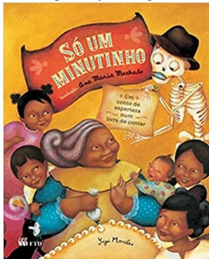
Figura 2: A morte em presença dialogal, em Só um minutinho