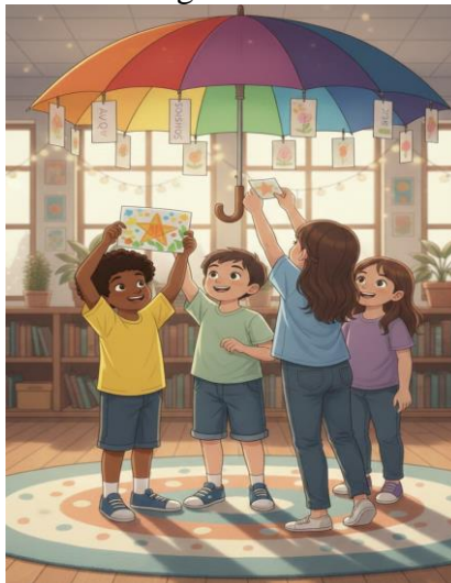
Figura 10: Confeccionando guarda-chuva de memórias