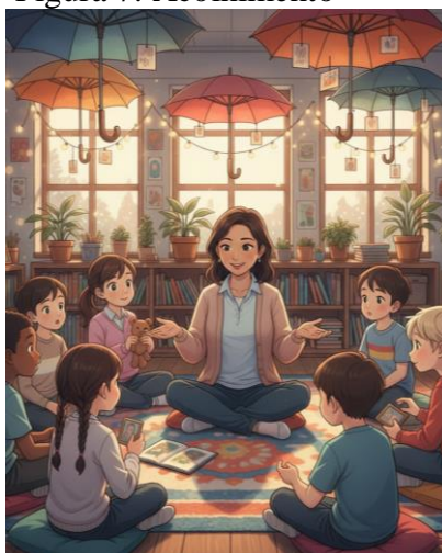
Figura 7: Acolhimento