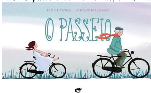
Figura 5: O passeio de memórias, em O Passeio