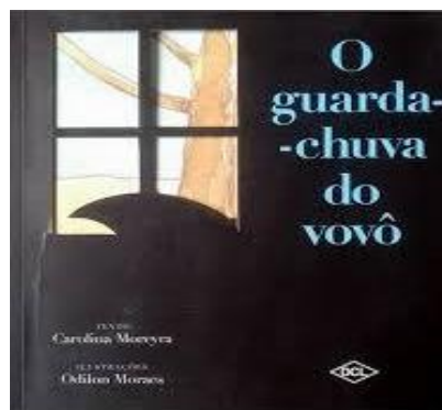
Figura 6: O guarda-chuva como vestígio, em O Guarda-Chuva do Vovô

A obra O Guarda-Chuva do Vovô , de Carolina Moreyra, com ilustrações de Odilon Moraes, foi selecionada como base para esta proposta de mediação leitora por apresentar uma abordagem sensível e poética da temática da morte na infância. Conforme a classificação proposta por Doná (2024), a narrativa configura-se como uma representação de morte subentendida, uma vez que o falecimento do avô não é explicitado no texto, sendo sugerido por meio da ausência, da memória e da relação afetiva entre o neto e o objeto que permanece: o guarda-chuva.