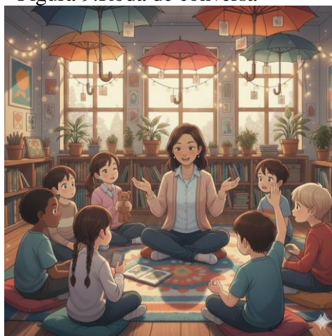
Figura 9: Roda de conversa