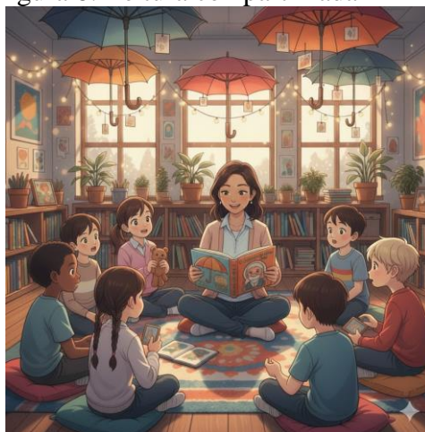
Figura 8: Leitura compartilhada