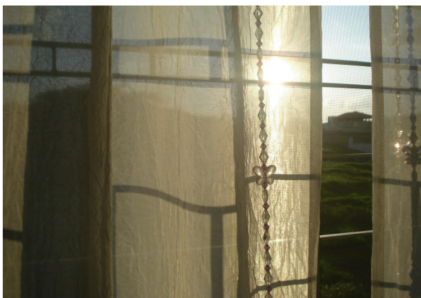
Figura 2: Cortina do capítulo “Cortina branca”.

Terá feito tudo, esse homem da tautologia, para recusar as latências do objeto ao afirmar como um triunfo a identidade manifesta - minimal, tautológica - desse objeto mesmo. [...] "Esse objeto que vejo é aquilo que vejo, um ponto, nada mais". Terá assim feito tudo para recusar a temporalidade do objeto, o trabalho do tempo ou da metamorfose no objeto, o trabalho da memória - ou da obsessão - no olhar. (DIDI-HUBERMAN, 1998, p.39)