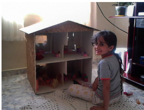
Figura 3: Casinha do capítulo “Caixas”.

As visualidades inseridas na obra também compõem esse trabalho de montagem. Elas não estão ali como forma de ilustrar o que foi escrito, mas como afirmações que ampliam e tensionam sentidos das memórias que surgiram como elementos articuladores da história que se conta. Didi-Huberman (2017) trata a imagem fotográfica como um arquivo visual que carrega tempo e camadas históricas, mesmo quando não se sabe nomear tudo o que ela mostra. O modo como elementos visuais foram organizados no livro corresponde a esse entendimento e é uma abertura para que o leitor interprete, junto comigo, o que pode emergir deles. A montagem, nesse ponto, também é um convite ao outro para exercitar as possibilidades da memória.