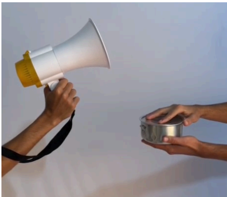
Figura 5: Principais símbolos utilizados na peça Ensaio para uma Revolução

Boal (2009, p. 21) ressalta que a arte “é o objeto, material ou imaterial. Estética é a forma de produzi-lo e percebê-lo. Arte está na coisa; Estética, no sujeito e em seu olhar”; e através desse processo teatral, consegui compreender a importância de desenvolver o olhar crítico às alegorias e auxiliar os alunos, ambos os que estavam atuando na peça, como os que estavam tocando os instrumentos ou assistindo ativamente, a desenvolver uma maior sensibilidade aos símbolos utilizados no teatro, podendo assim ser melhores espectadores (Desgranges, 2003) e mais responsáveis spect-atores , pois “um símbolo só é um símbolo se é aceito por dois interlocutores: o que transmite e o que recebe” (Boal, 2013, p.127)