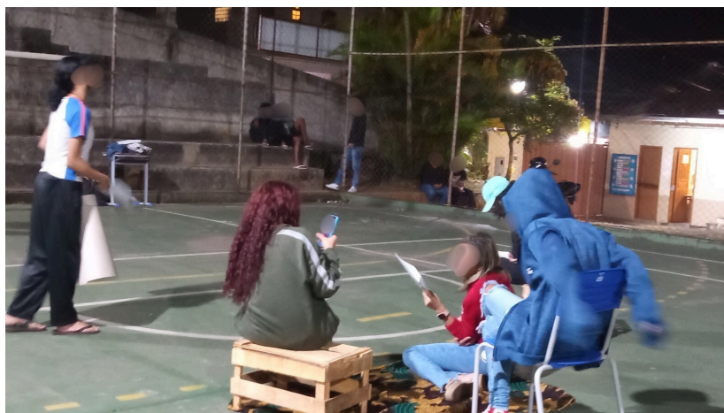
Figuras 2 e 3: Ensaio das turmas do 1º ano 1 e 1º ano 6, respectivamente, na quadra da escola.