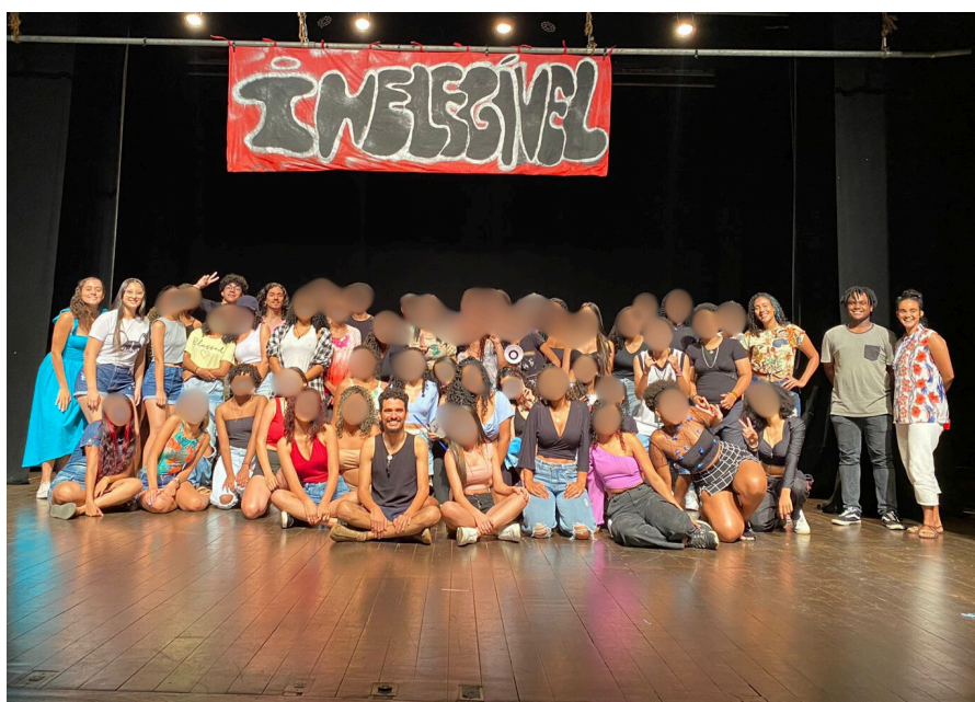
Figura 4: Foto de todos os participantes do espetáculo pré-apresentação.

Apesar disso, a apresentação foi muito satisfatória para todos os presentes: público, atores/atrizes, professor e bolsistas. Todas as turmas demonstraram grande desenvoltura para lidar com todo e qualquer imprevisto antes e durante o espetáculo e se apropriaram com orgulho das críticas que estavam trazendo para debate com a peça, detalhe muito importante das crenças teatrais de Boal (2009), que defende que a função do teatro como social e política, buscando a conscientização política do público e dos atores (coringas) que estarão trazendo o conteúdo para debate, além da busca pela liberdade e emancipação da comunidade.