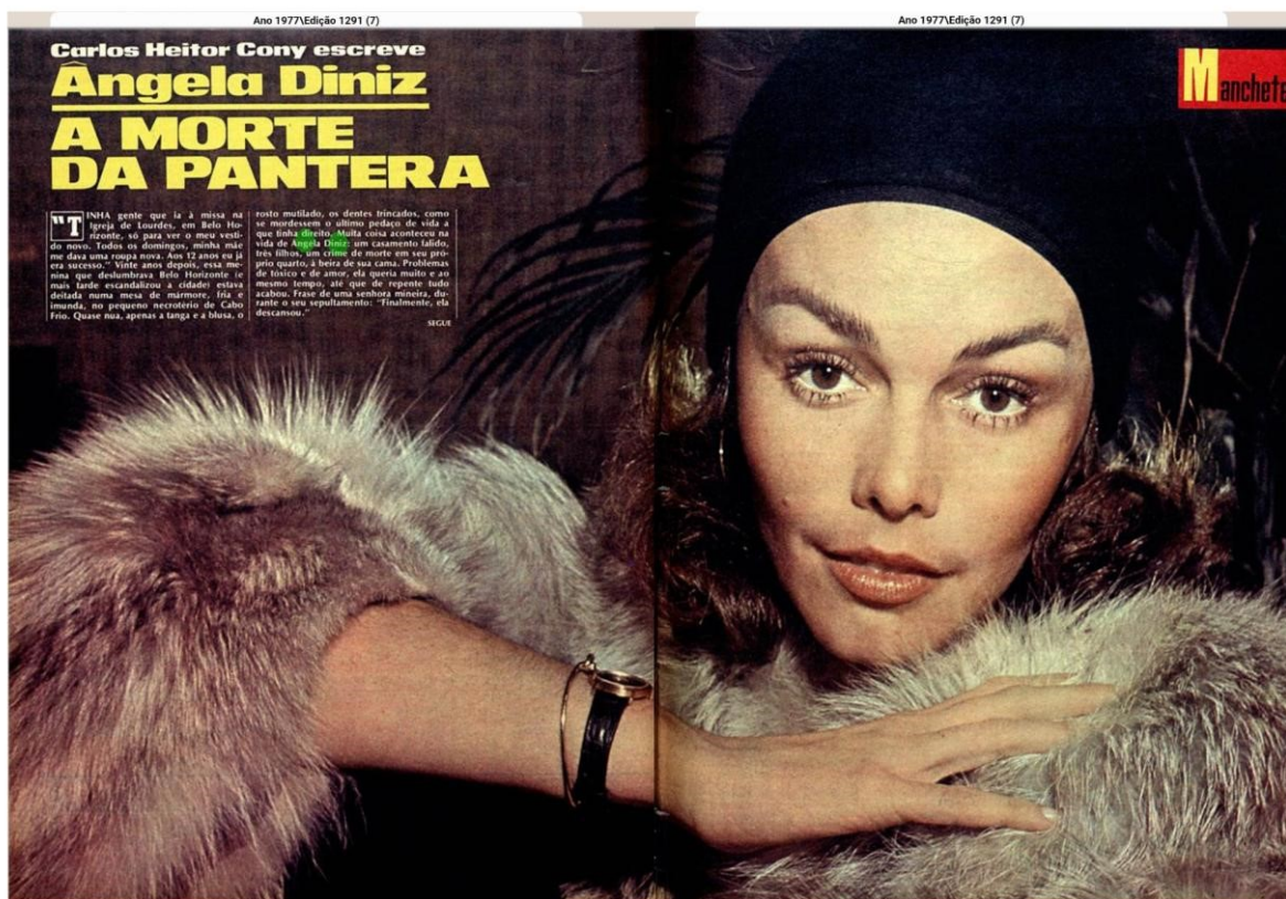
Figura 03: “A Morte da Pantera”