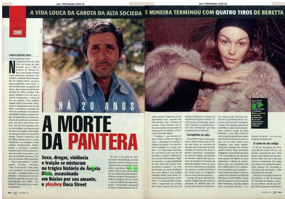
Figura 07: “Há 20 Anos: A Morte da Pantera”