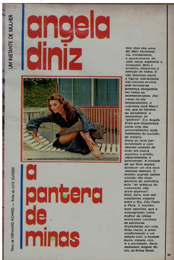
Figura 01: “A Pantera de Minas”