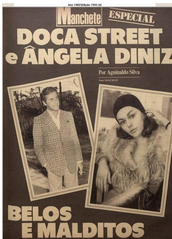
Figura 04: “Belos e Malditos”