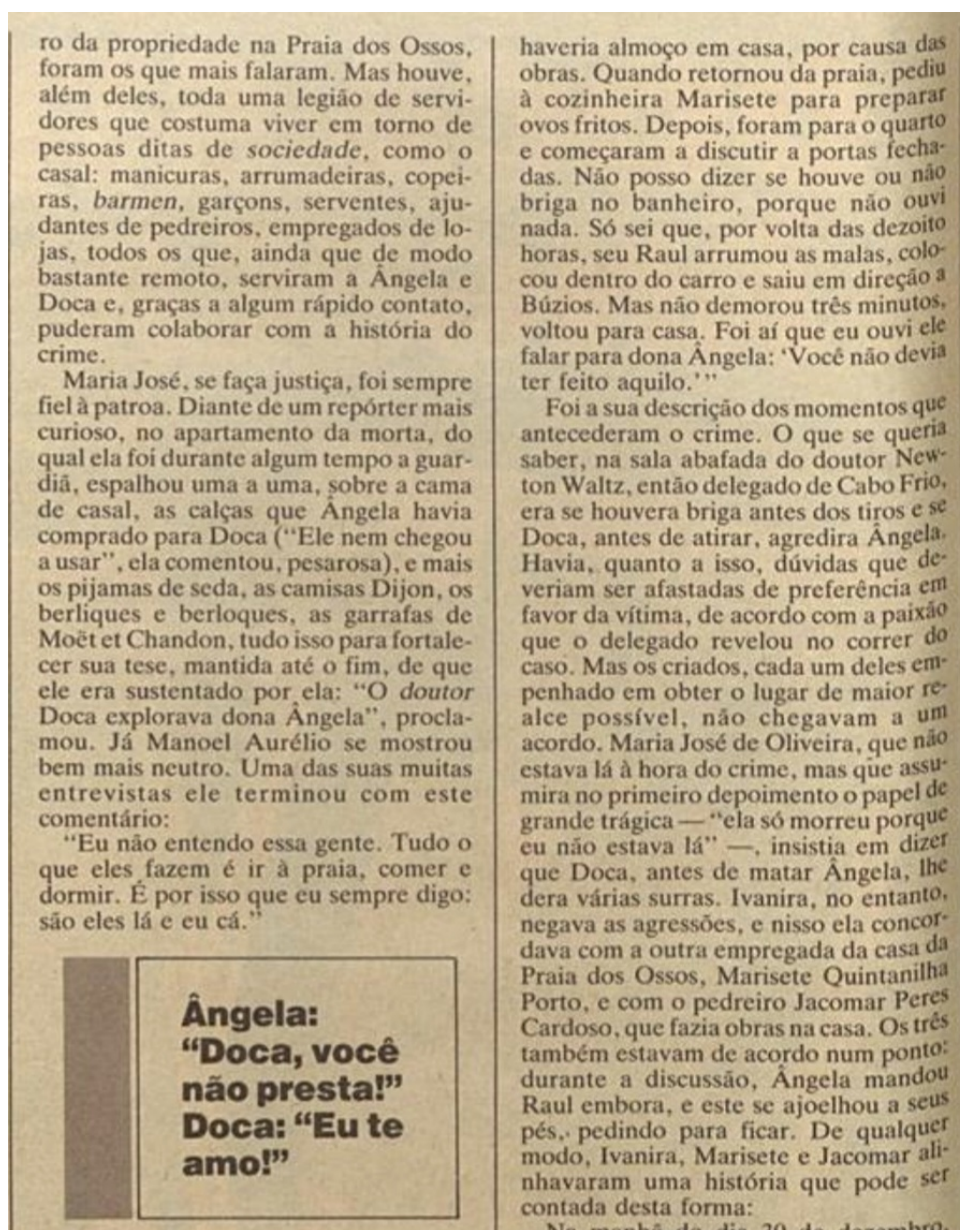
Figura 08: Trecho da matéria “Belos e Malditos”