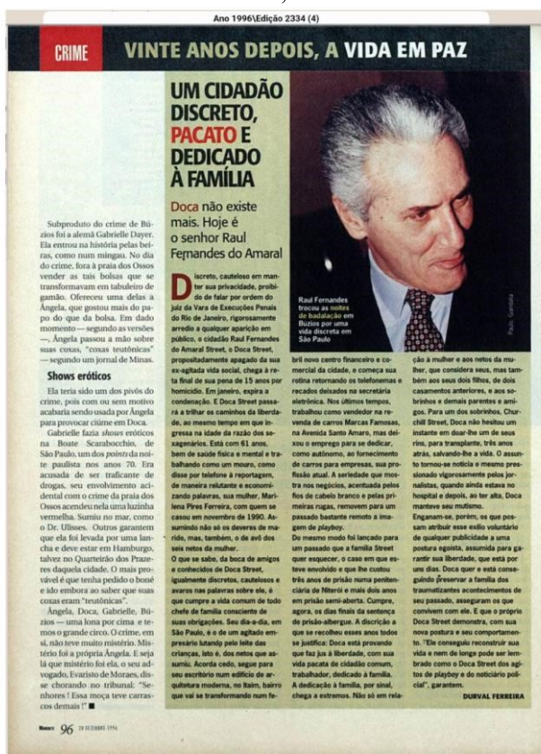
Figura 09: “Um Cidadão Discreto, Pacato e Dedicado à Família”