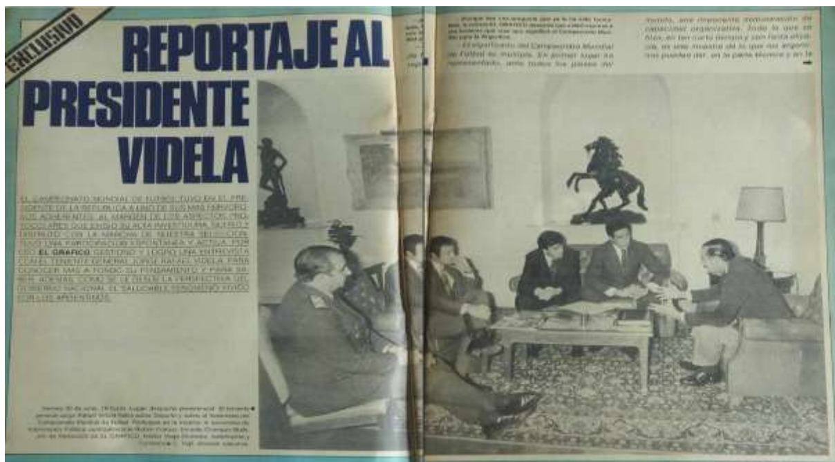
Figura 12: encontro e entrevista especial El Gráfico com o presidente Videla