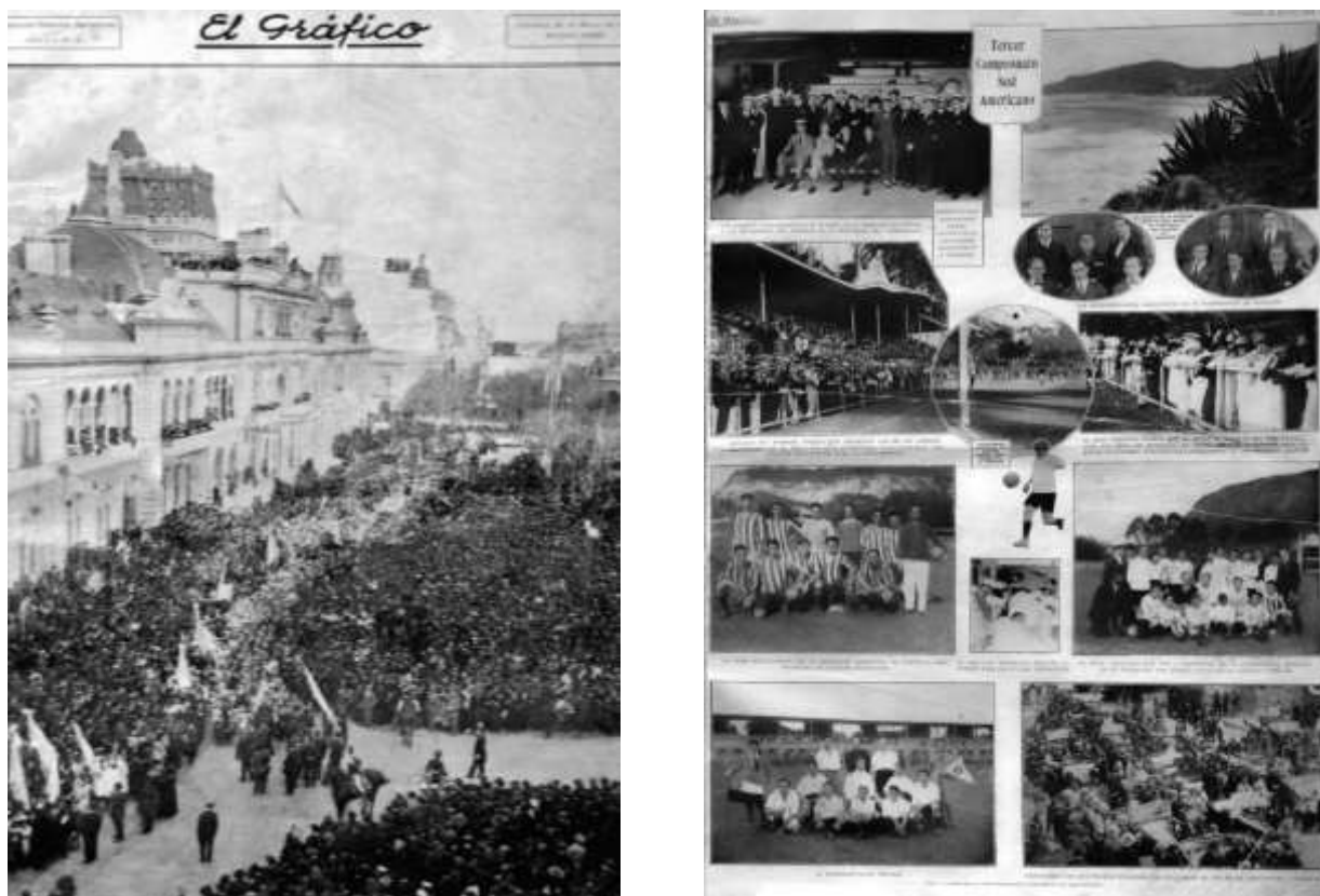
Figuras 1 e 2: capa da primeira edição El Gráfico , e página 3 da mesma edição (com o primeiro destaque para o futebol)