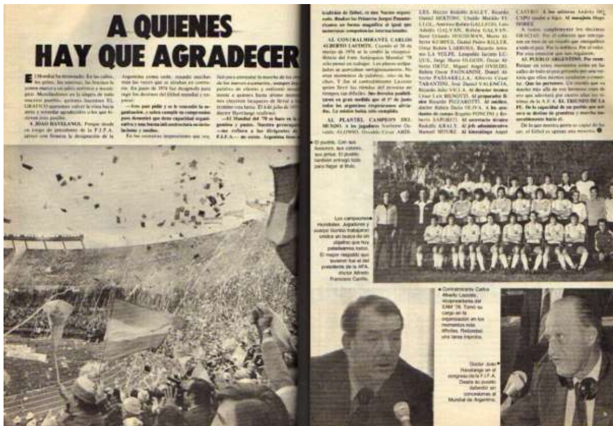
Figura 11: reportagem especial “A quem há que agradecer”

de “boca cheia”. Naquela imagem, a fusão estava completa, com a vitória da seleção sendo, visual e narrativamente, uma vitória do Regime.