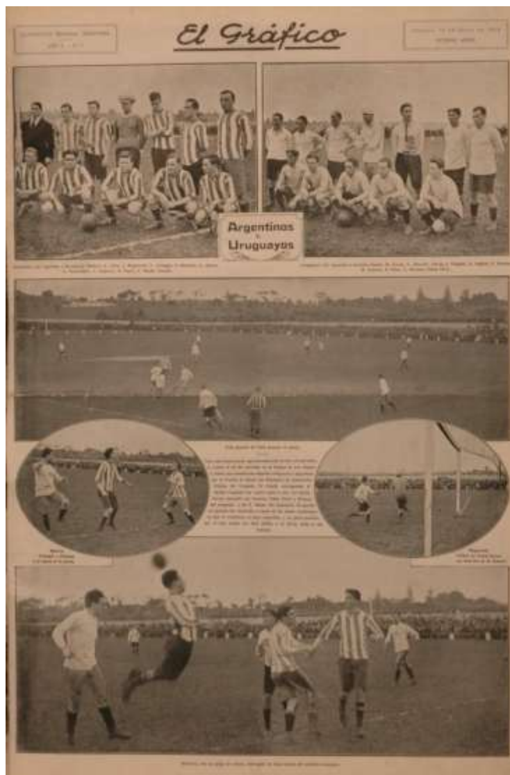
Figura 3: primeira capa El Gráfico dedicada ao futebol