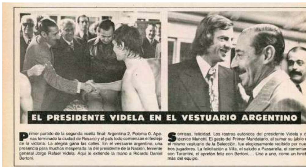
Figura 10: matéria destaca encontro de Videla com jogadores no vestiário