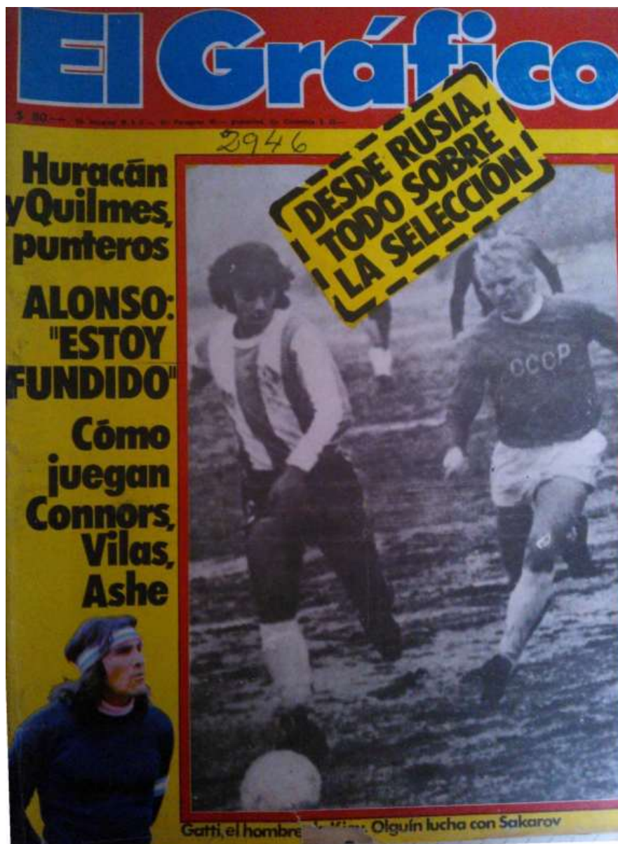
Figura 4: capa El Gráfico do dia exato do Golpe de 76’