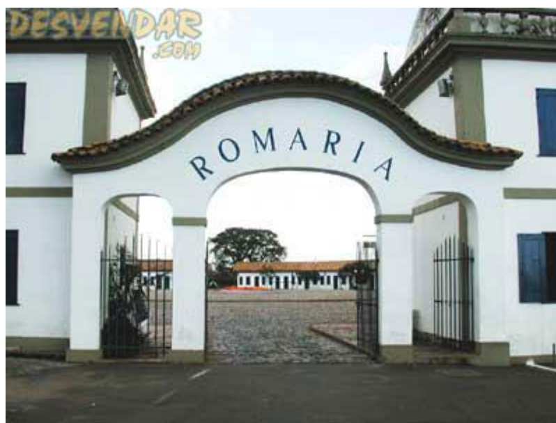
Figura 4 Romaria

Até ser demolida, ela servia de abrigo aos romeiros pobres, que desde os anos de 1770 frequentam Congonhas no período de 7 a 14 de setembro, para os festejos do Jubileu do Senhor Bom Jesus de Matosinhos. Hodiernamente, funciona como Centro Cultural e Centro de Eventos da cidade. Ela está localizada na Alameda das Palmeiras, uma área que foi tombada pela Unesco (PREFEITURA..., 2008).