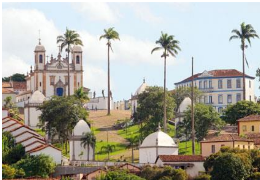
Figura 1 Vista da Basílica do Senhor Bom Jesus de Matosinhos

1796 foi o ano em que Antônio Francisco Lisboa, o Aleijadinho, foi contratado para esculpir os personagens que representariam as cenas do calvário de Jesus Cristo e também os profetas, que seriam colocados nas escadarias e no adro da igreja. Embora o adro já estivesse pronto, Aleijadinho preferiu iniciar o trabalho pelas figuras da Via Sacra. Vale ressaltar que as obras foram policromadas pelos mestres Manuel da Costa Athayde e Francisco Xavier Carneiro (PREFEITURA..., 2008).