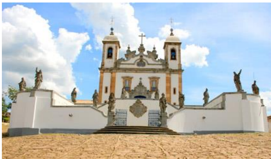
Figura 3 Basílica do Senhor Bom Jesus de Matosinhos e os Profetas

Abrindo a representação, Jeremias e Isaías de frente e atrás deles, no primeiro patamar, Baruc e Ezequiel. No terraço do adro estão Daniel e Oséias, de perfil. Mais além, Jonas e Joel dão-se as costas e nos ângulos curvilíneos do pátio, Abdias e Habacuc erguem um dos braços. Nas extremidades do arco, Amós e Naum apresentam-se de frente (PROFETAS..., 2005).