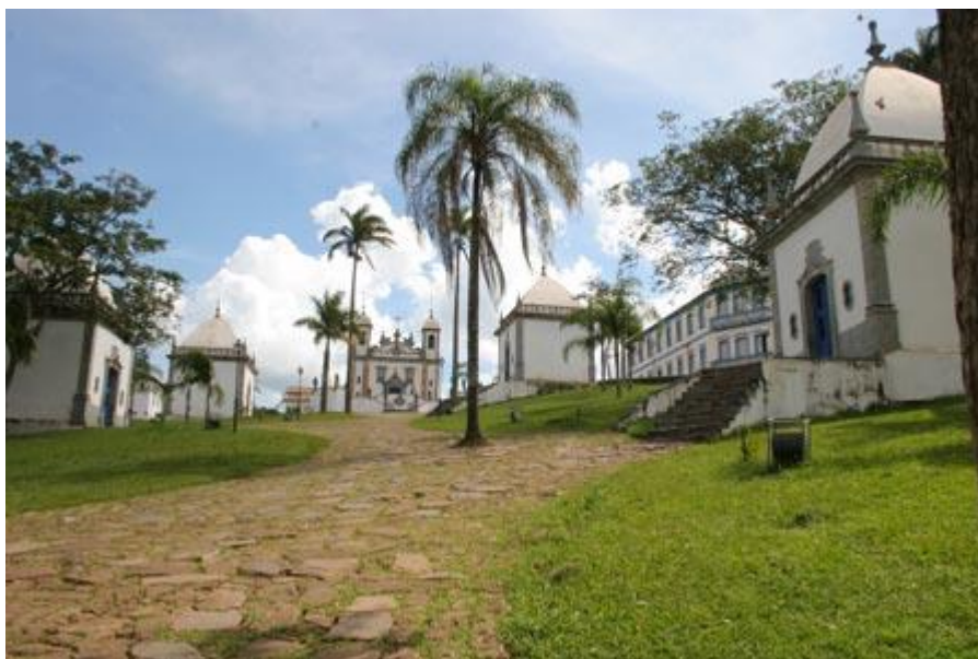
Figura 2 Passos da Paixão