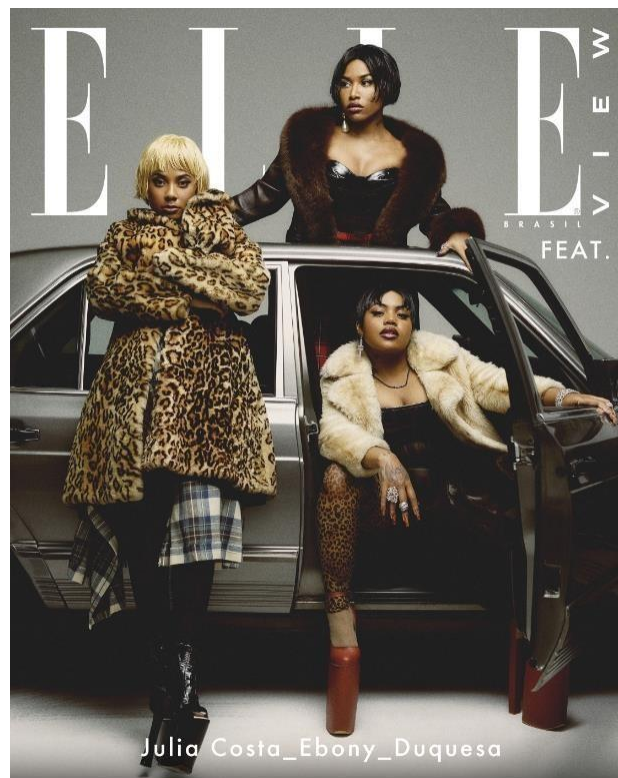
Figura 2: Capa da ELLE VIEW 2024