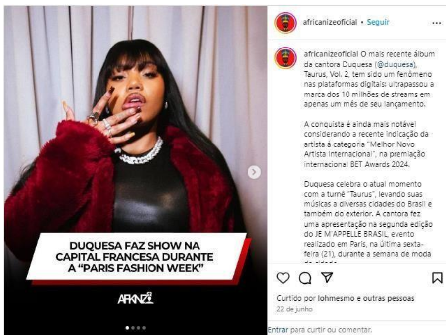
Figura 5: Post do perfil africanize sobre o show da rapper Duquesa em Paris