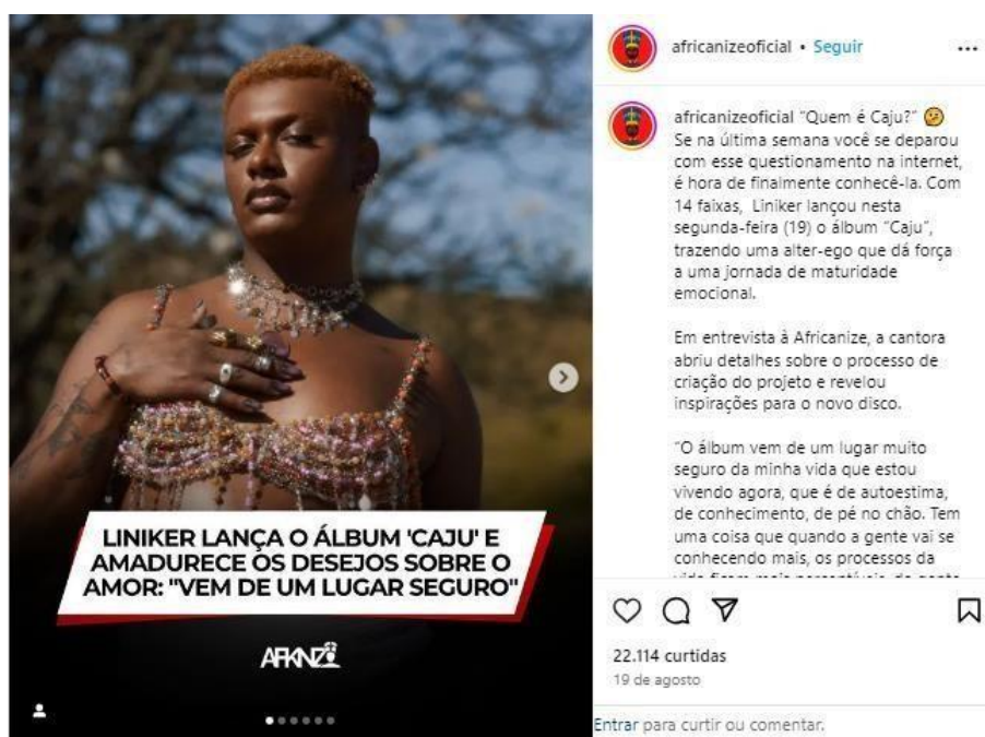
Figura 8: Post do perfil Africanize sobre o novo álbum da artista Liniker