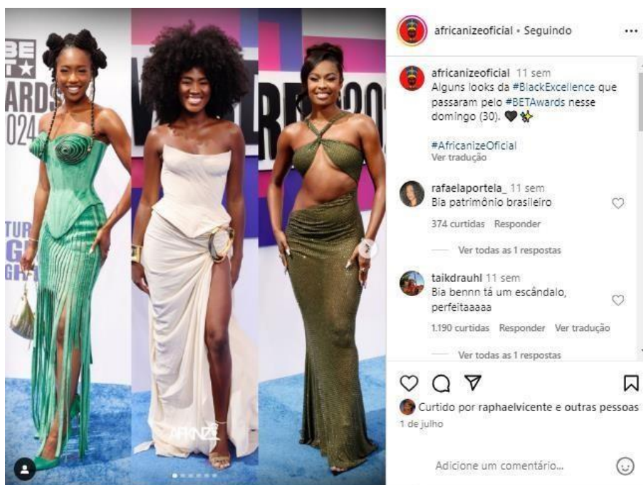
Figura 4: Post do perfil africanize sobre o prêmio BET Awards