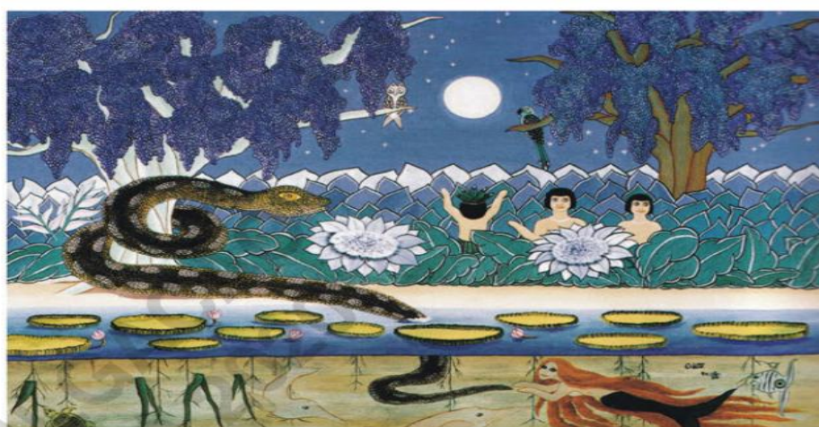
Sucuridjedá n. 3 (Suite) (1988), de Odete Brussolo. Óleo sobre tela de eucatex, 702 cm x 100 cm.