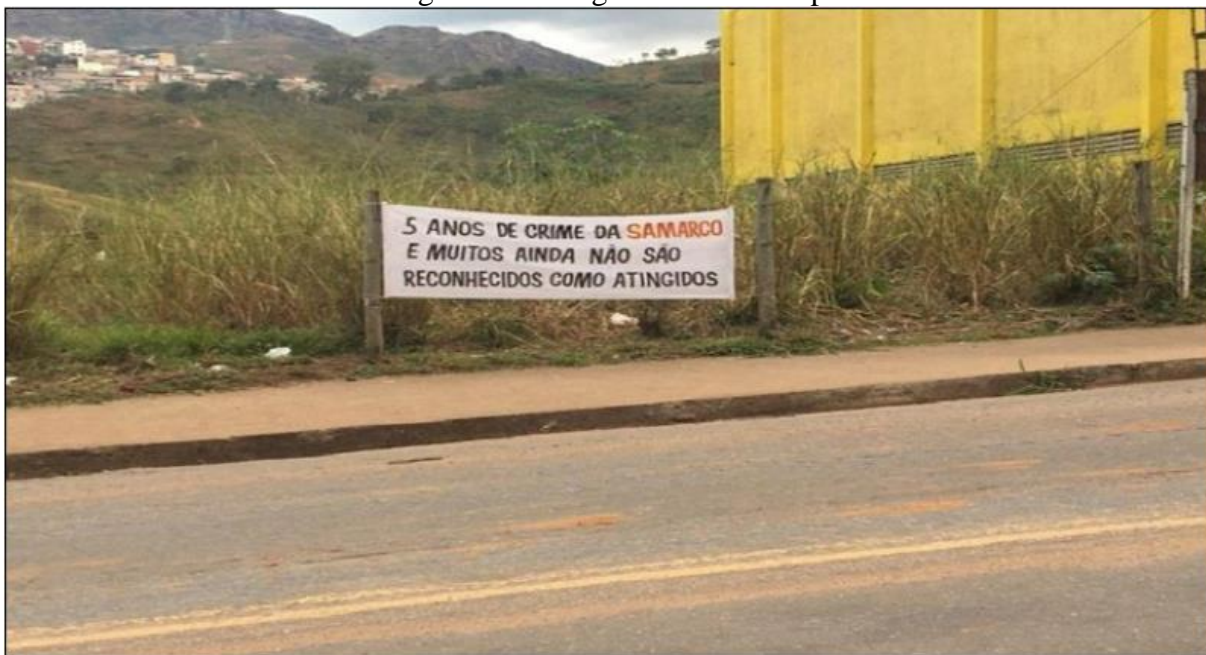
Figura 01 - Imagem da Faixa de protesto.

Ilustrando a situação, constata-se uma faixa fixada na altura da Rodovia dos Inconfidentes, próxima ao prédio da rede supermercadista Supermercados BH, em Mariana-MG. Sem autoria evidente, a faixa expõe os seguintes dizeres: “5 ANOS DE CRIME DA SAMARCO E MUITOS AINDA NÃO SÃO RECONHECIDOS COMO ATINGIDOS”. Por ela, se expressa para todos que trafegam por esse caminho o anseio vivido dia após dia pelos afetados, em especial, aqueles que não são reconhecidos como atingidos, conforme apresentado na Figura 01 . Uma circunstância que os impossibilita acesso aos instrumentos institucionais capazes de nortear e concretizar as ações de reparação.