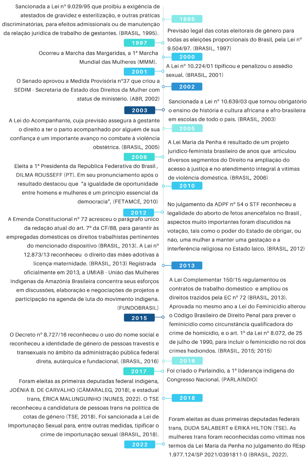
Figura IV: Linha do tempo: Democracia, Direitos e Movimentos Feministas no Brasil. Parte II.