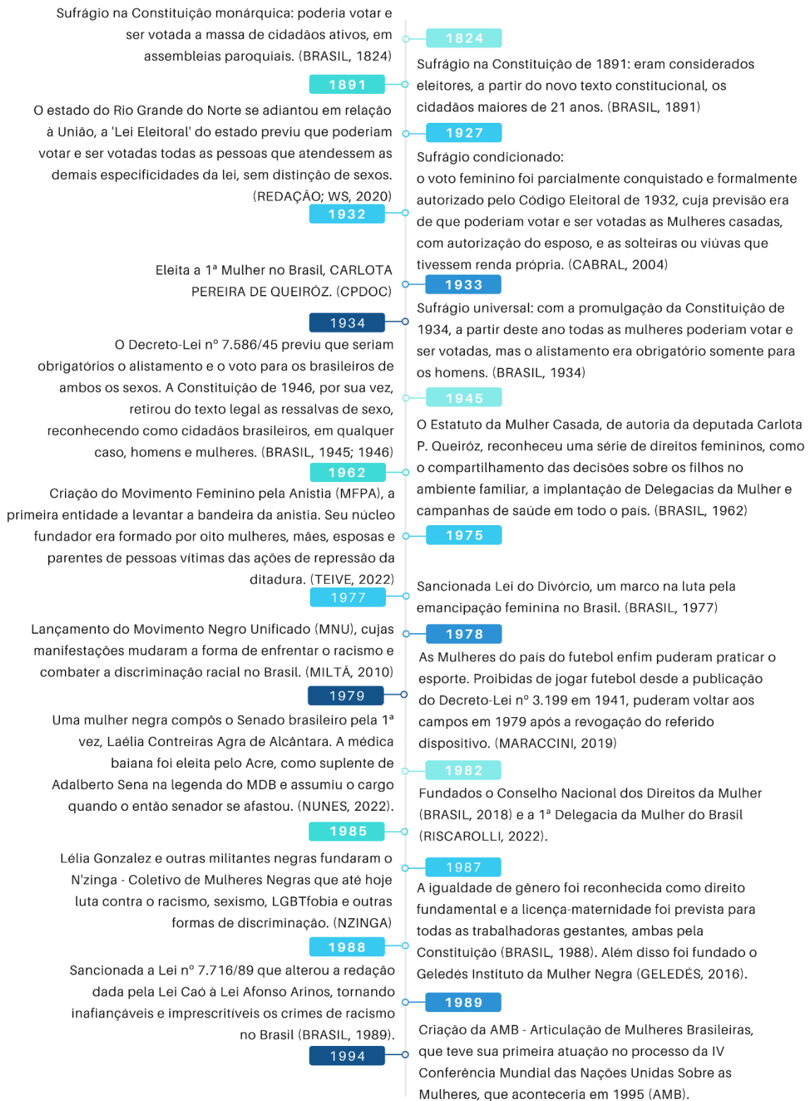
Figura III: Linha do tempo: Democracia, Direitos e Movimentos Feministas no Brasil. Parte I.