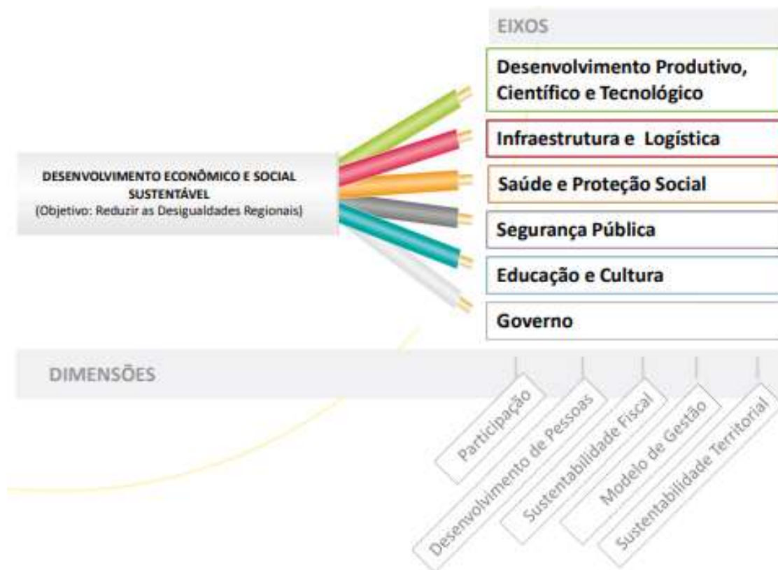
Figura 4 -Eixos do Planejamento Econômico e Social PMDI 2016-2017