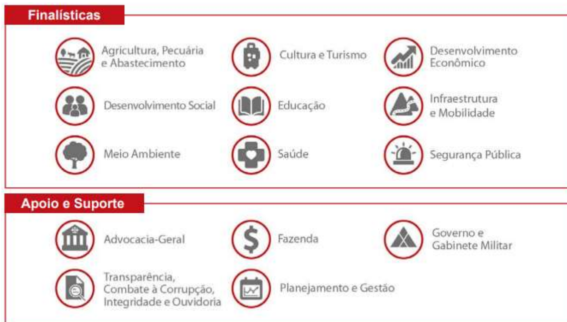
Figura 6 -Áreas Temáticas Finalísticas e Áreas Temáticas de Apoio e Suporte