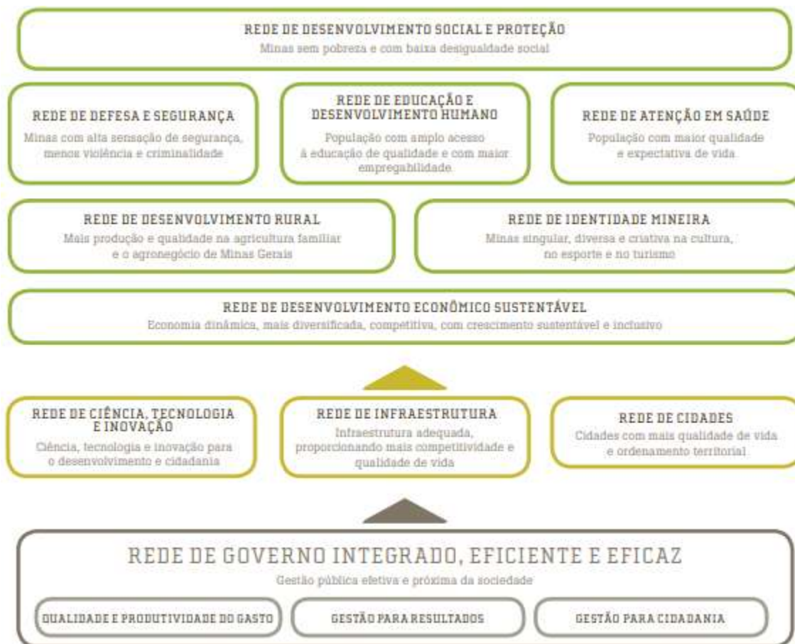
Figura 3 -Redes de Governabilidade do PMDI 2011-2030