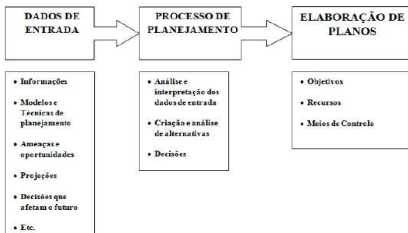
Figura 1 - Processo de Planejamento

Segundo Maximiano (2010), ele é uma dimensão de competências e também um processo de tomada de decisões. Para Montana (2010), o processo de planejamento envolve a escolha do destino, avaliação de diferentes meios e definição de qual estratégia específica será utilizada para se chegar ao destino escolhido. O processo do planejamento compreende três etapas principais demonstradas abaixo segundo Maximiano (2010):