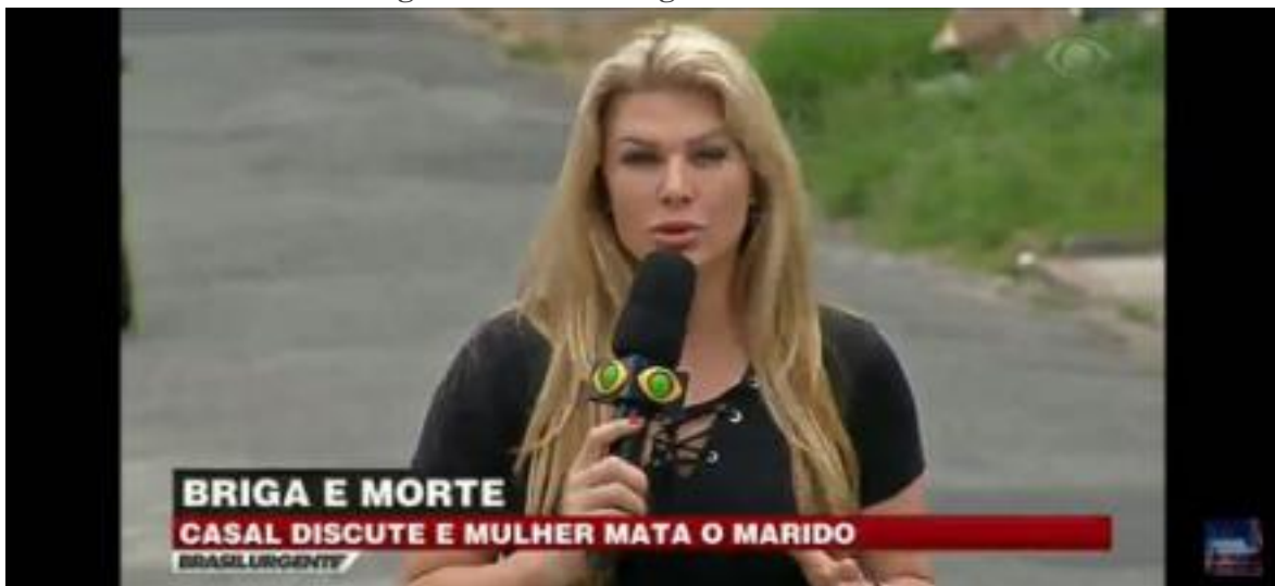
Imagem 05 - Brasil Urgente Escalada D