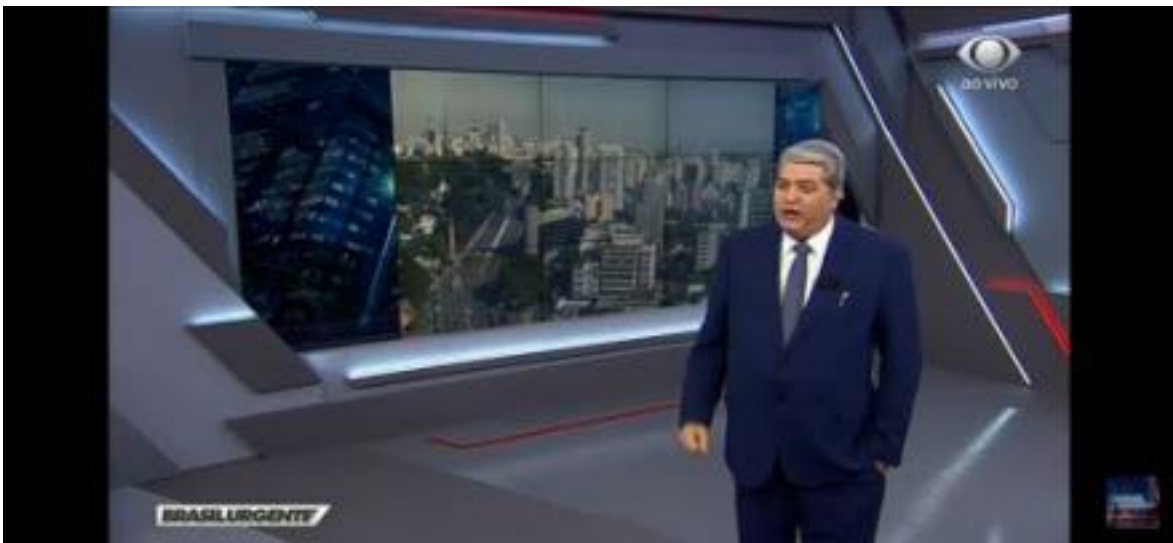
Imagem 01-Brasil Urgente Abertura