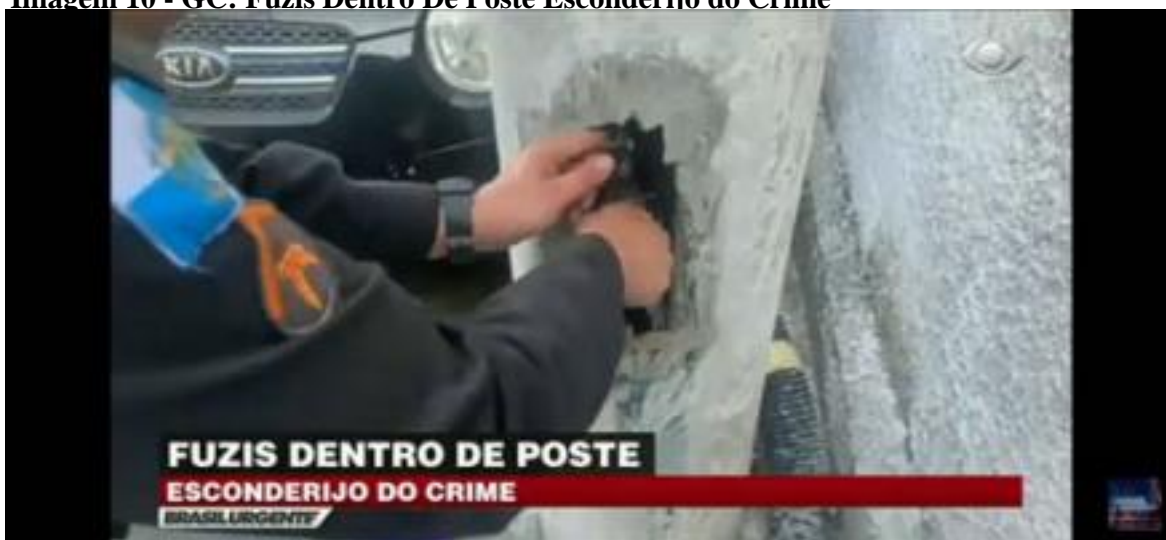
Imagem 10 - GC: Fuzis Dentro De Poste Esconderijo do Crime