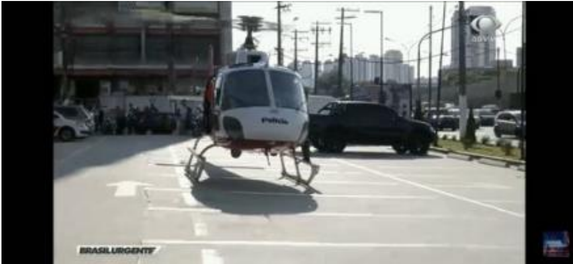
Imagem 08 - Brasil Urgente Escalada F

Fonte: https://www.youtube.com/watch?v=s74f3xDMKzw&t=3117s (2019)