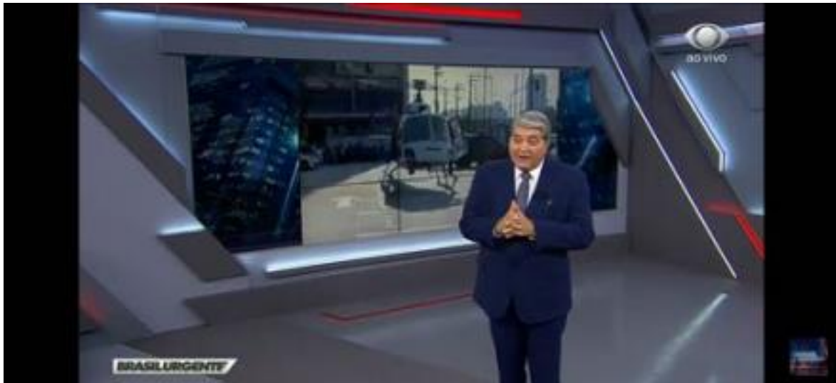
Imagem 07 - Brasil Urgente Escalada F