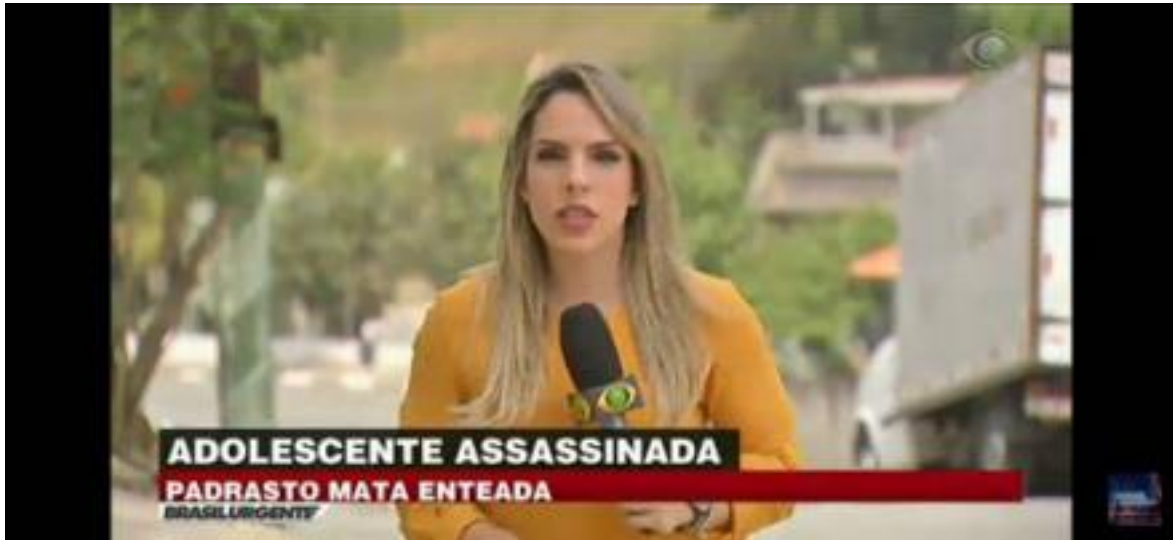
Imagem 06 - Brasil Urgente Escalada E