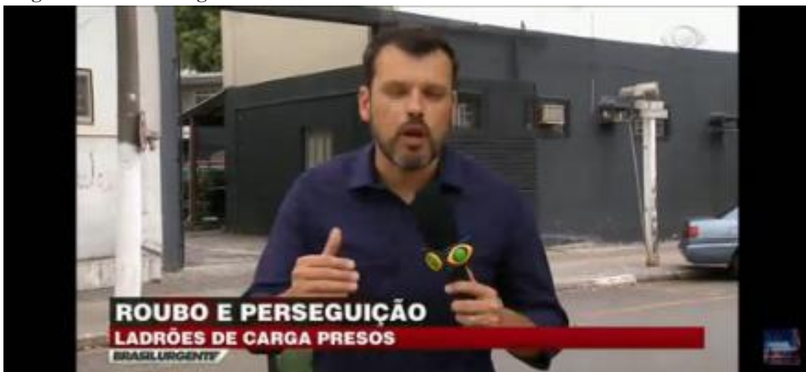
Imagem 03 - Brasil Urgente - Escalada B