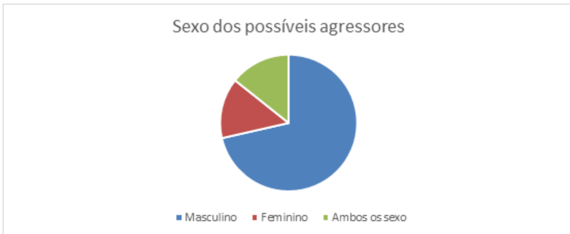
Gráfico III: Sexo dos possíveis agressores

Com base nesses sete entrevistados, a análise de dados das próximas perguntas começa a focar nos possíveis casos de assédio moral dentro da IES de estudo. Com a pesquisa foi identificado que, a maioria dos casos os possíveis agressores foi/foram pessoa (s) do sexo masculino e que todos eles possuíam/possuem um nível ocupacional superior dentro da IES com relação as vítimas. O gráfico III mostra os dados esses dados coletados: