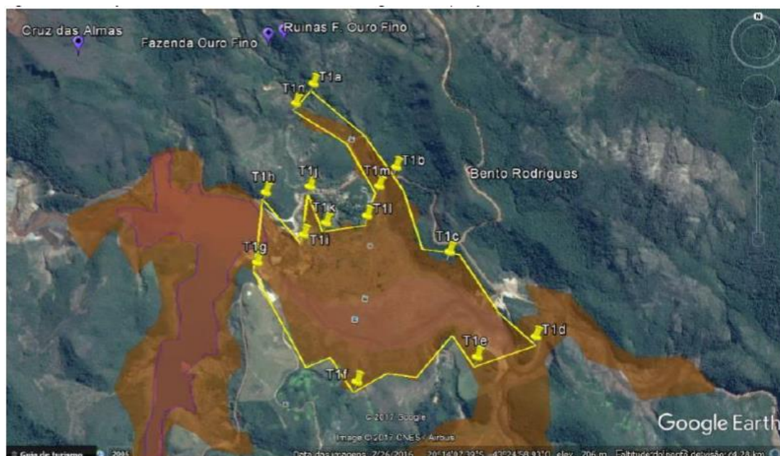
Figura 1: Perímetro de Tombamento T1: