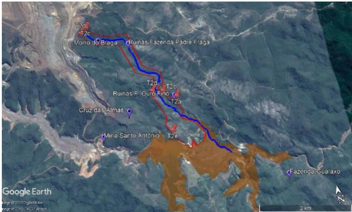
Figura 2: Perímetro de Tombamento T2