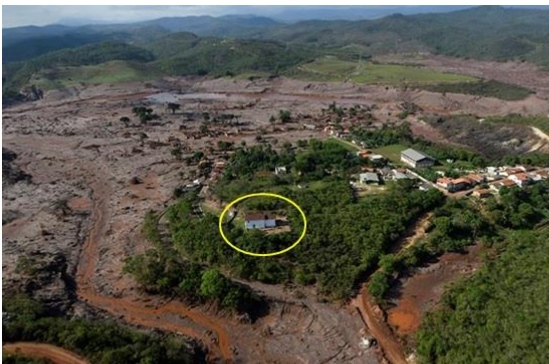
Figura 4: Capela Nossa Senhora das Mercês

Histórico e Artístico de Minas Gerais, (IEPHA/MG). A capela foi uma das poucas edificações não afetadas pelo desastre e passou a ser o principal espaço de uso comunitário pelos atingidos de Bento.